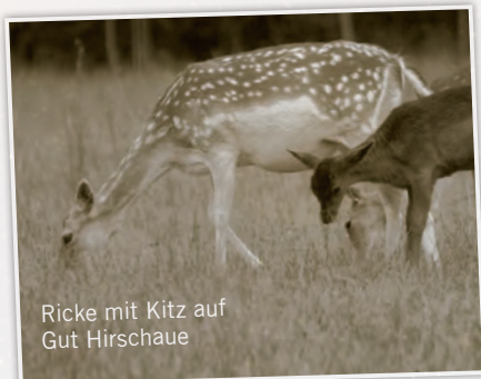
Ricke mit Kitz auf Gut Hirschaue

Auf einer bemehlten Fläche aus dem Teig ca. 2 cm dicke Stränge rollen und diese in ca. 3 cm lange Stückchen schneiden. Salzwasser zum Kochen bringen, Hitze reduzieren bis das Wasser noch leicht köchelt, dann die Gnocchi hineingeben. Sobald sie an die Oberfläche aufsteigen, sind die Gnocchi gar. Herausheben und mit dem Wildragout servieren.